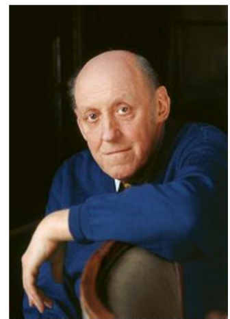
Bo Carpelan (1926 – 2011) författare