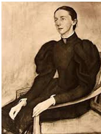
Matilda Wrede (1864 – 1928) befrämdare fångvården