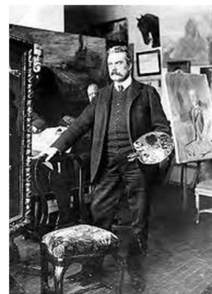
Albert Edelfelt (1854 – 1905) konstnär