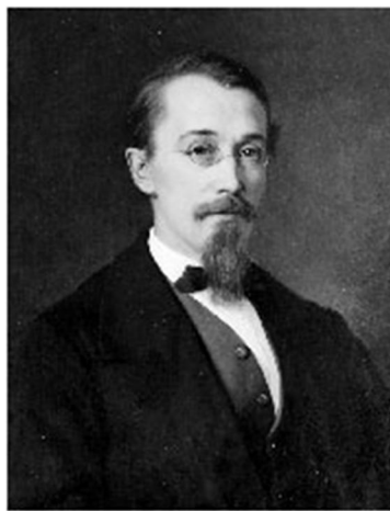
Yrjö-Sakari Yrjö-Koskinen (1830 – 1903) finska språkets förkämpe